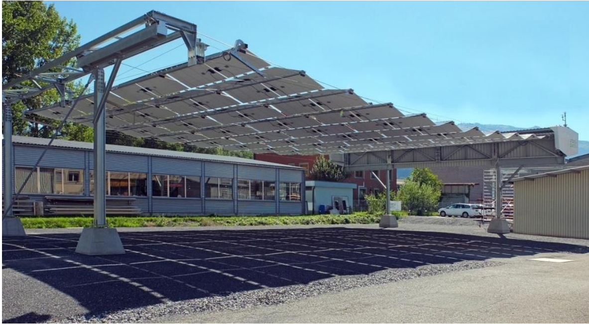
Demonstrationsanlage der LE-Light Energy Systems AG in Balzers